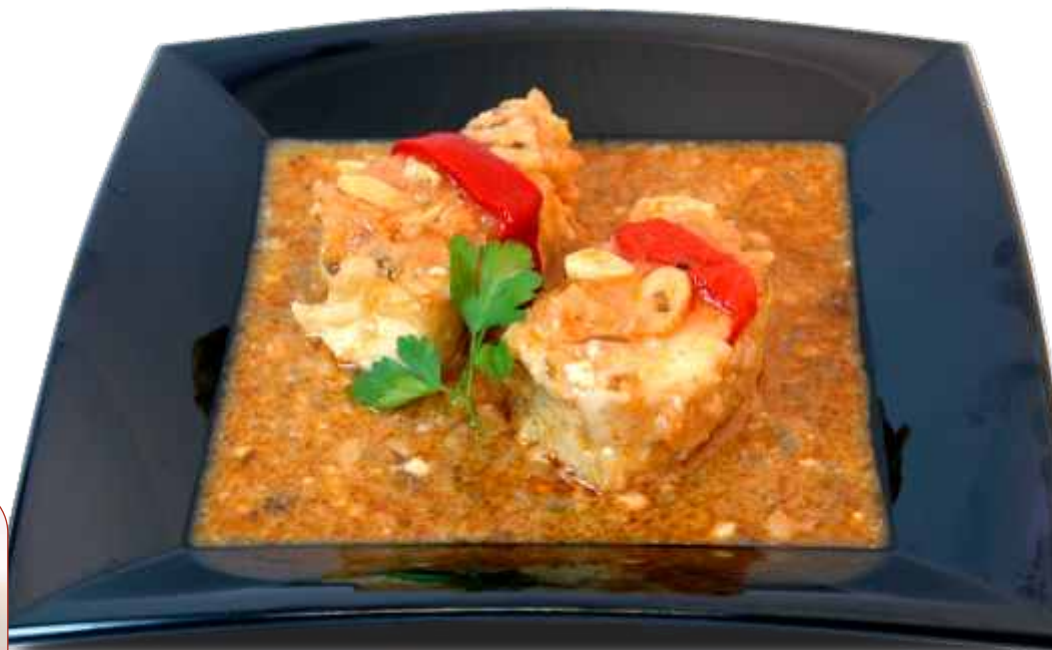
Bacalao ajoarriero / Cod ajoarriero