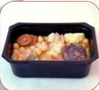
Cocido madrileño / Madrid stew