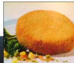
Burger verdura excelente