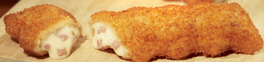
Souflé queso fundido & York Snack maxi