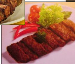
Snack picante "Amigo"