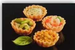
Canapé gourmet para catering El lujo del horno. 5* 4 exquisitos sabores