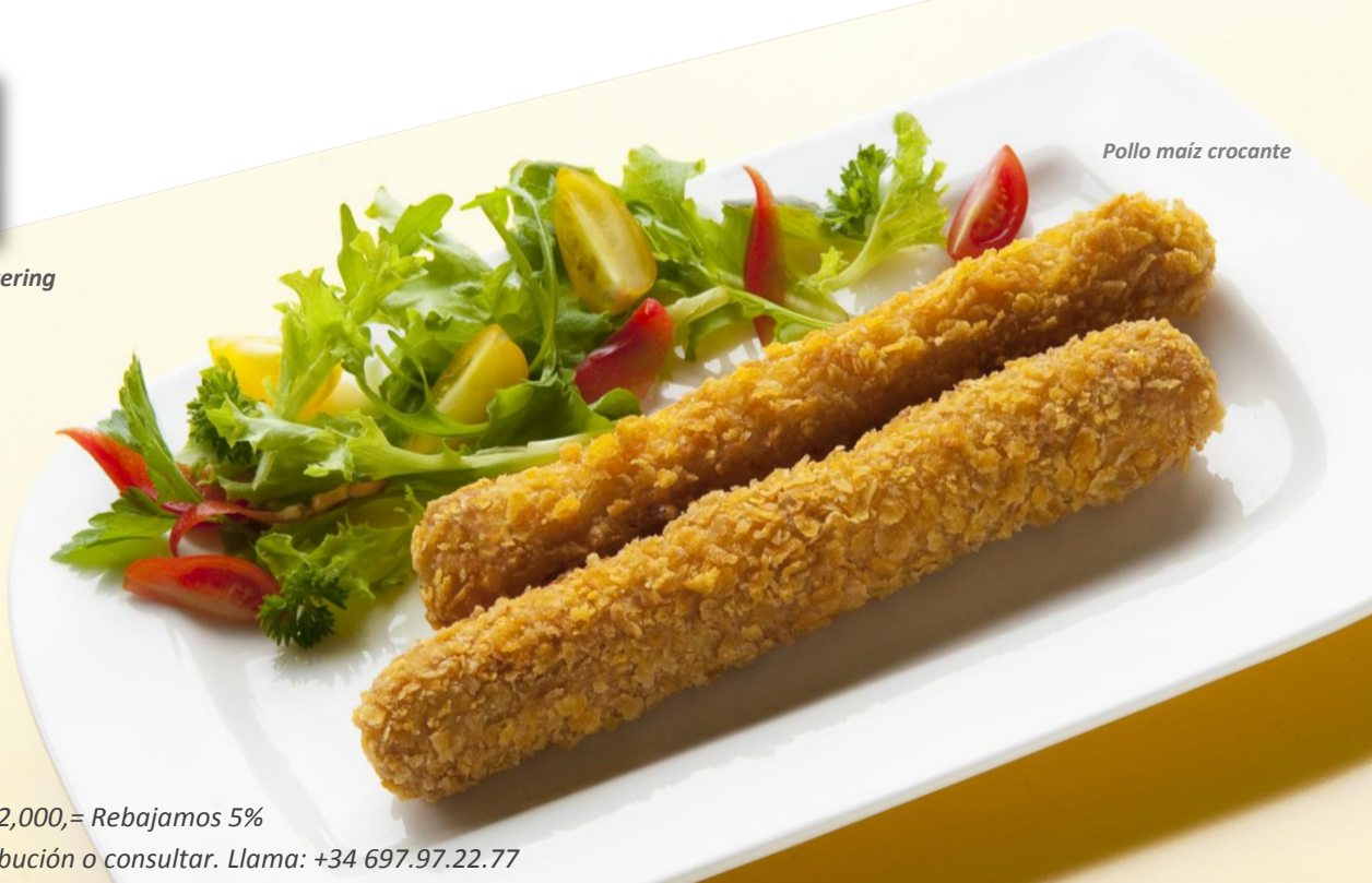
Pollo maíz crocante

En pedidos superiores a € 2,000,= Rebajamos 5%