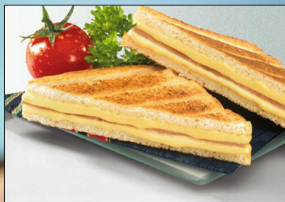
Sandwich "comida light"