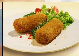
Maxi Croquetas realmente carne