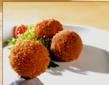
Bolita celebración de carne crujiente