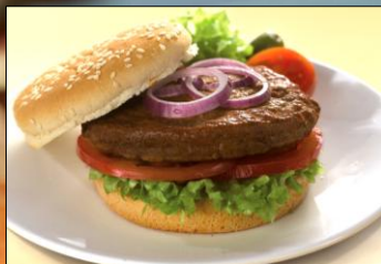
Hamburguesa especial freír