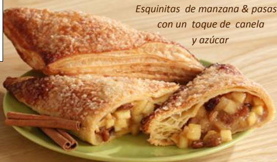
Esquinitas de manzana & pasas con un toque de canela y azúcar