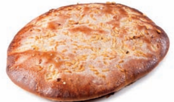
84 COCA pequeña piñón