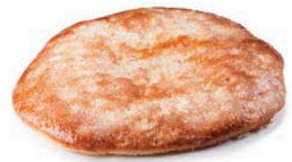
42 COCA pequeña cabello