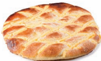
44 COCA pequeña crema