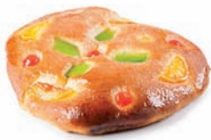
218 COCA mini fruta