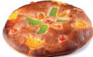
40 COCA pequeña fruta