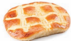
217 COCA mini crema