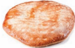
219 COCA mini cabello