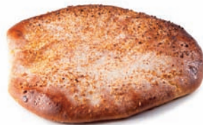
38 COCA pequeña almendra