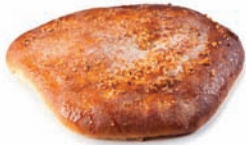
216 COCA mini almendra