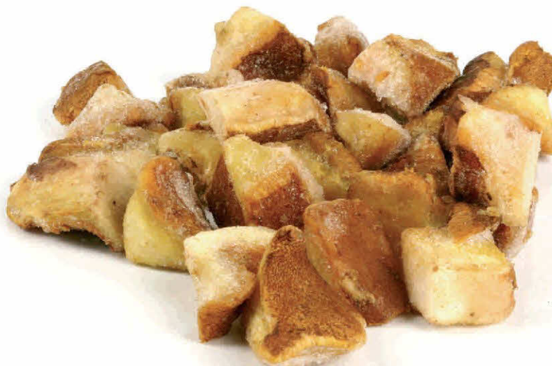
Boletus Suillus Lutius (Baboso, Boletito Anillado)

Envasado Ultracongelado SIN CONSERVANTES