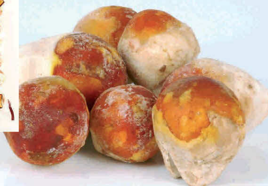
Amanita Caesarita (Huevo de Rey)

Envasado Ultracongelado SIN CONSERVANTES