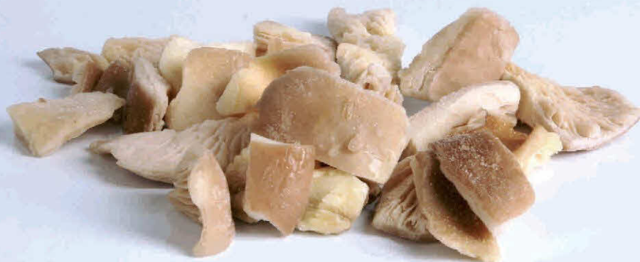
Pleurotus Ostreatus (Seta de Concha, Seta de Ostra)

Envasado Ultracongelado SIN CONSERVANTES