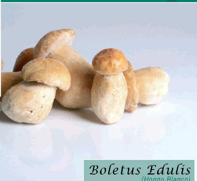
Boletus Edulis (Hongo Blanco)

Envasado Ultracongelado SIN CONSERVANTES