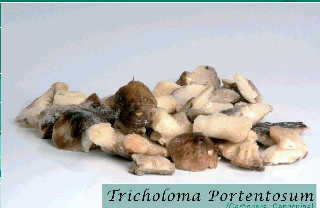
Tricholoma Portentosum (Carbonera, Capuchina)

Envasado Ultracongelado SIN CONSERVANTES