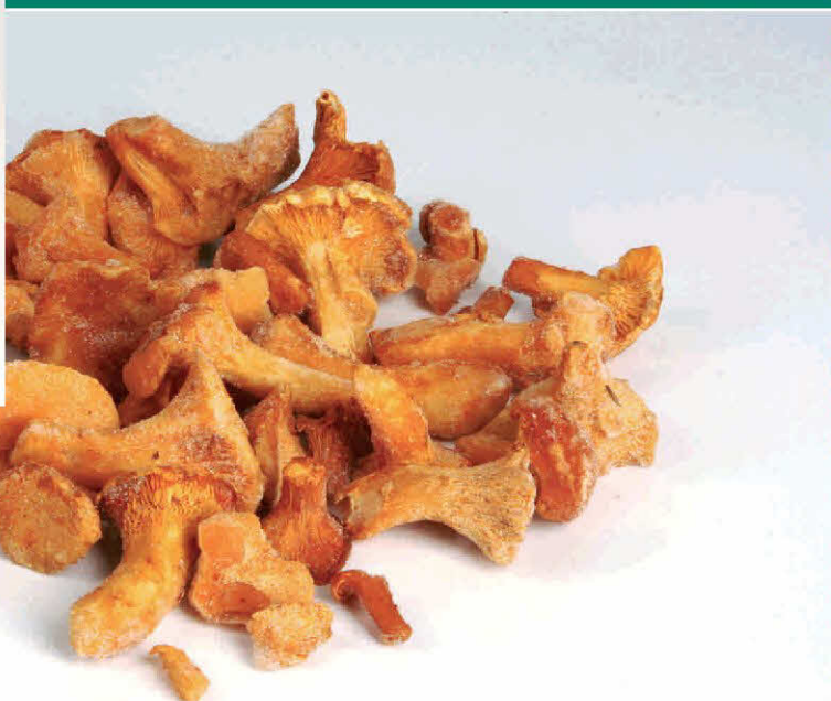
Cantharellus Cibarius (Cantarela, rebozuelo)

Envasado Ultracongelado SIN CONSERVANTES