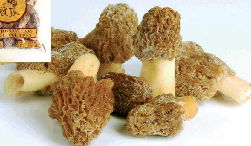
Morchella Cónica (Colmenilla, cagarria, pantorra, zarrota)

Envasado Ultracongelado SIN CONSERVANTES