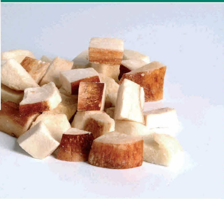
Boletus Edulis Troceado (2x2 cm. aprox.) (Hongo Blanco)

Envasado Ultracongelado SIN CONSERVANTES