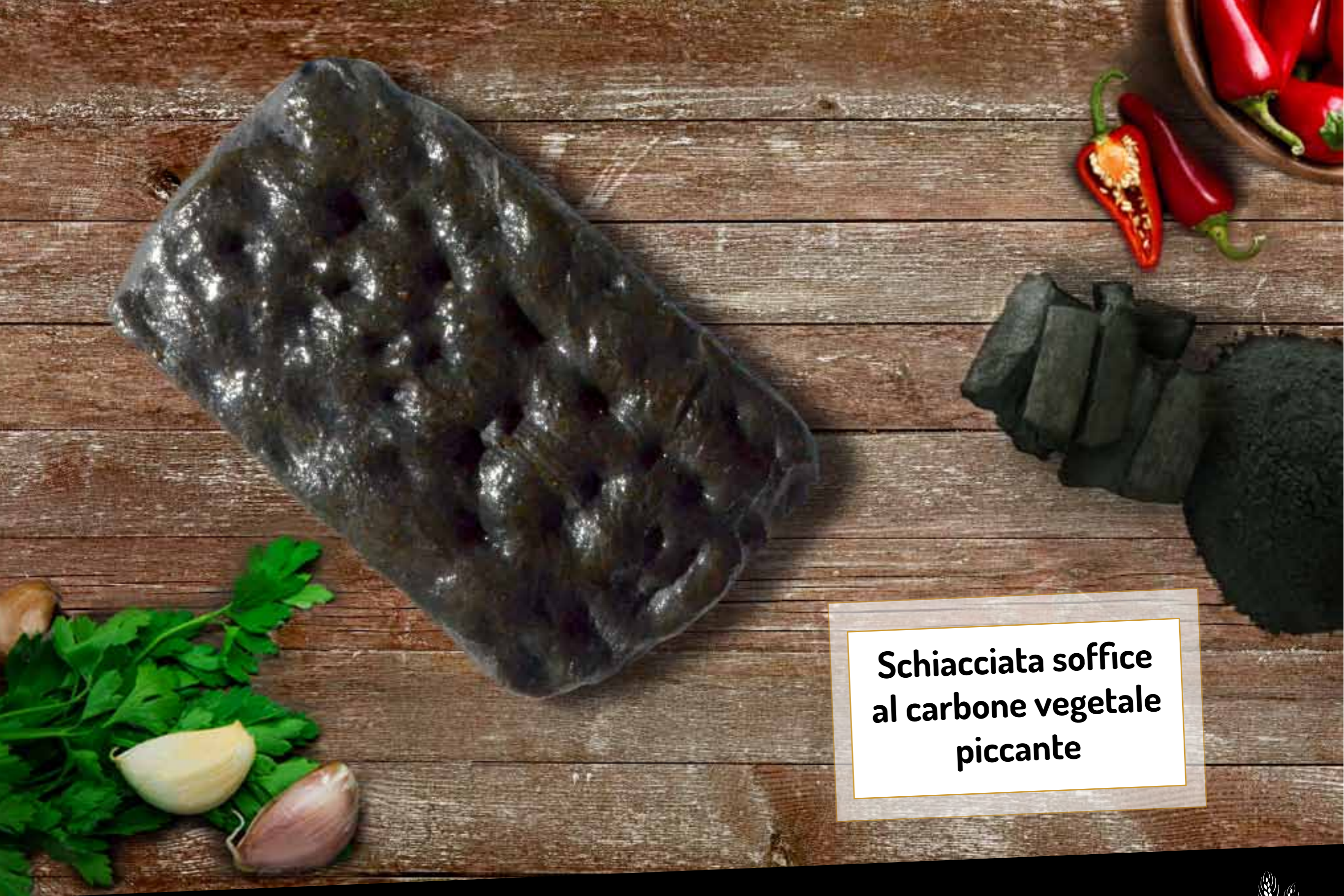
Schiacciata soffice al carbone vegetale piccante