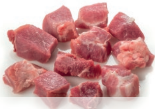
Tacos para estofado