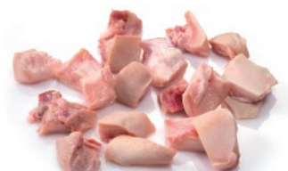
Morro crudo cortado