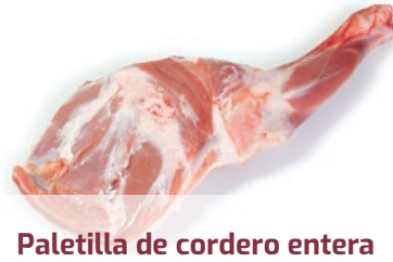
Paletilla de cordero entera