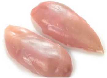
Pechuga de pollo sin hueso