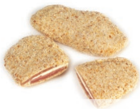
Libritos de cerdo empanados