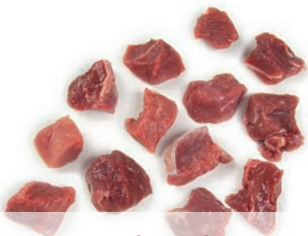
Tacos de cordero