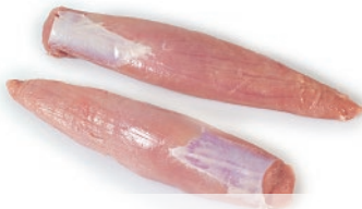
Solomillo sin cordón