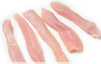
Tiras de pavo