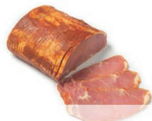
Lomo de cerdo adobado