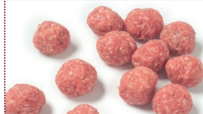
Albóndigas de vacuno 30g