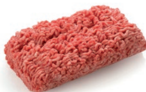
Preparado de carne picada cerdo/vacuno/mixta