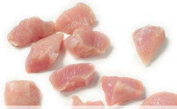
Tacos de pavo