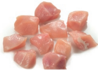
Tacos de pollo