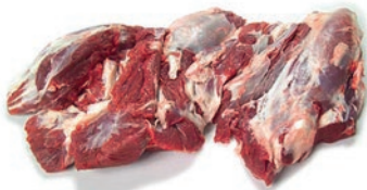
Morcillo de paletilla