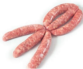
Salsicha de cerdo 36g