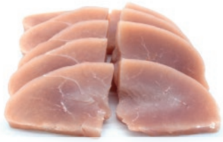
Pechuga de pavo fileteada