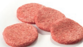
Burger neat vacuno 80g/100g aprox.