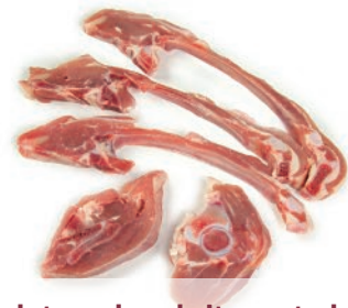
Chuletero de cabrito cortado