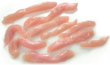
Tiras de pollo