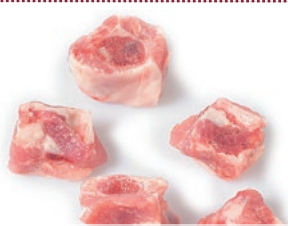
Tacos de costilla