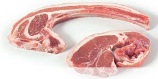
Chuletero de cordero cortado