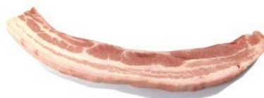
Panceta con piel cortada