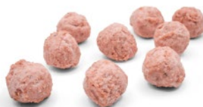
Pelotas 100% vegetales