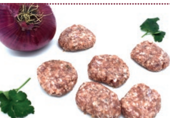
Mini burger con cebolla 30g