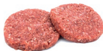
Hamburguesa 100% ajojo 100 g/200g aprox.