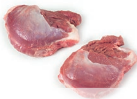
Carrillada con hueso