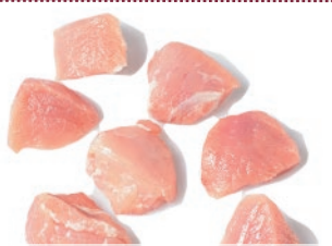
Taco magro para estofar