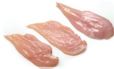
Pechuga de pollo fileteada