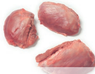
Carrillada sin hueso