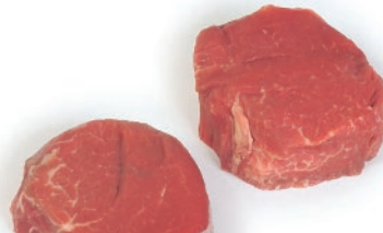
Solomillo cortado 60g/90g/120g aprox.