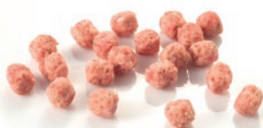
Mini albóndigas mixtas con ajo y perejil 6g