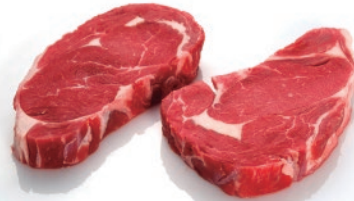
Entrecot de lomo Alto S/H 200g/250g/300g/350g aprox.