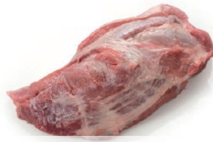
Cabeza lomo entera