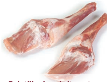
Paletilla de cabrito entera