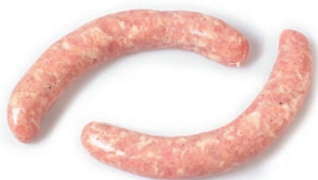
Longaniza fresca de cerdo