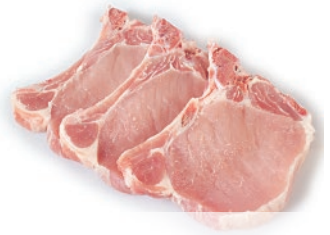
Centro de chuleta cortada