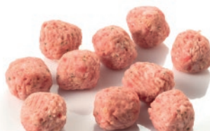
Albóndigas mixtas con ajo y perejil 30g