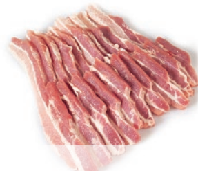
Panceta sin piel cortada