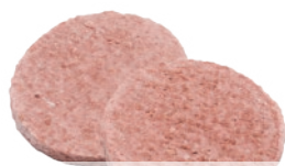
Burger 100% vegetal