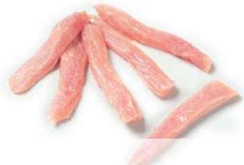
Tiras de cerdo