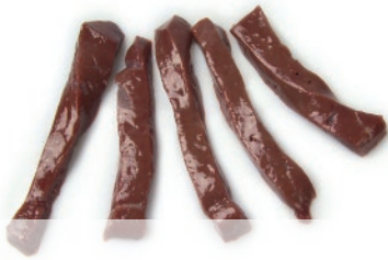
Tiras de hígado