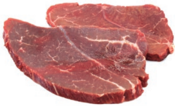
Bistec aňojo cortado 120g/150g/180g aprox.