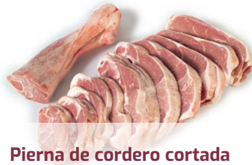
Pierna de cordero cortada