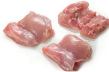
Contramuslo de pollo deshuesado sin piel