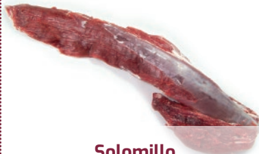
Solomillo < 2,700 Kg.