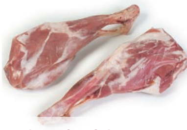
Pierna de cabrito entera