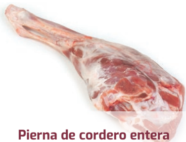
Pierna de cordero entera