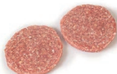
Burger meat mixto 60g/80g/100g aprox.