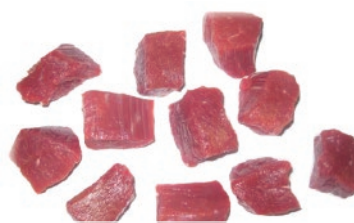
Tacos para estofado