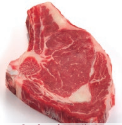
Chuletón aňojo 275g/325g/400g/500g/ 800g/900g aprox.