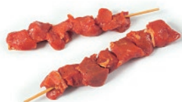
Pinchos de cerdo al pimentón 60g/90g aprox.