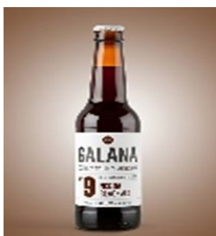
Nº 9 Negra 33cl . Caja 15 und Ref. 0109