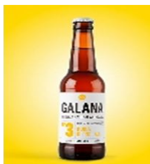
Nº 3 Rubia 33cl . Caja 15 und Ref. 0103