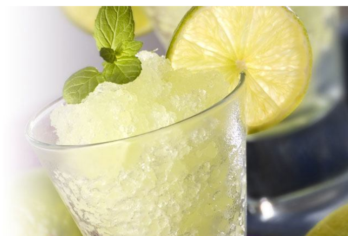
Limón Ref. 0244