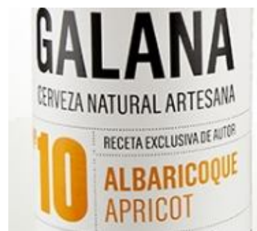
Nº 10 Albaricoque 33cl . Caja 15 und Ref. 0110