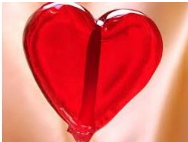
Piruleta Ref. 0240