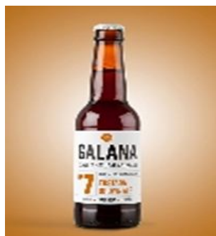
Nº 7 Tostada 33cl . Caja 15 und Ref. 0107