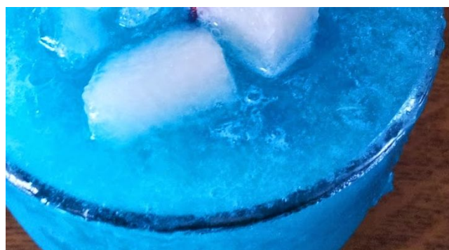
Chicle Ref. 0241