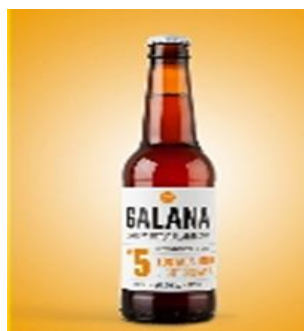
Nº 5 Tostada media 33cl . Caja 15 und Ref. 0105