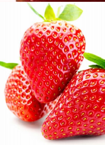
Fresa Ref. 0243