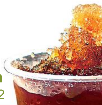
Cola Ref. 0242