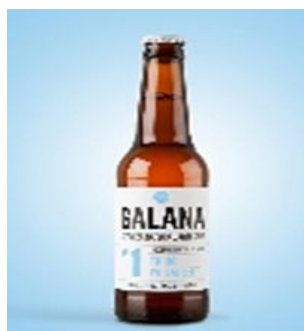
Nº 1 Trigo 33cl . Caja 15 und Ref. 0101