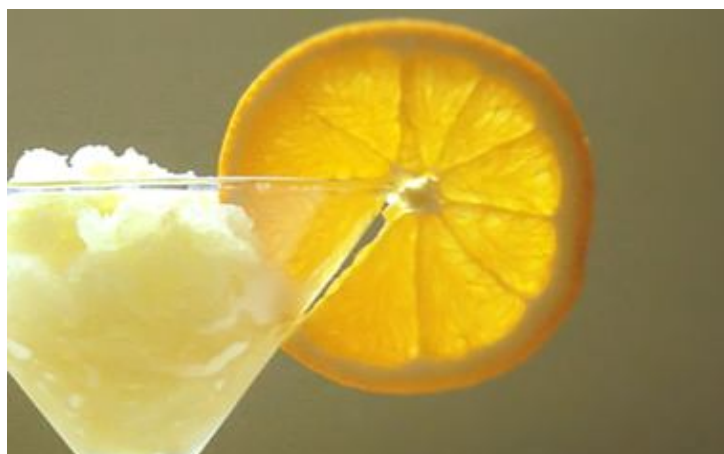
Naranja Ref. 0245